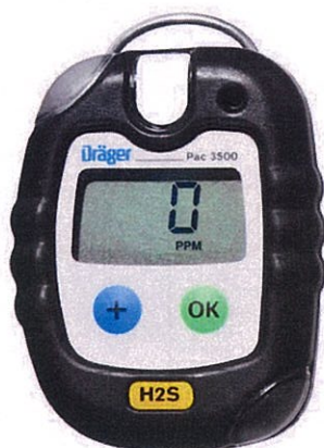
Рисунок 1 – Внешний вид газоанализаторов Dräger Pac модели Pac 3500.

Внешний вид газоанализаторов представлен на рисунках 1, 2, 3 и 4.