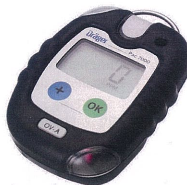
Рисунок 4 – Внешний вид газоанализаторов Dräger Pac модели Pac 7000 с сенсором OV-A.