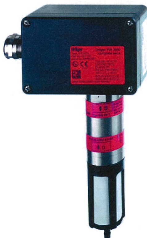
Рисунок 4 – Датчик оптический инфракрасный Dräger модели PIR 3000