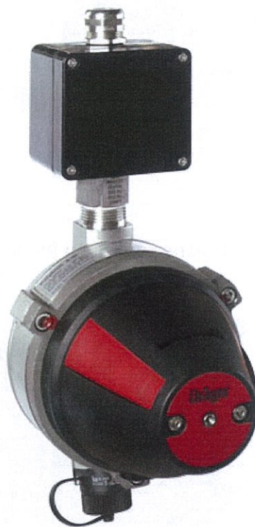
Рисунок 1 – Датчик оптический инфракрасный Dräger модели Polytron IR

Внешний вид датчиков приведен на рисунках 1 - 4. В зависимости от комплектации (например, вид клеммной коробки, защиты от внешних воздействующих факторов, адаптера для подачи ГС и др.) внешний вид датчика может изменяться.