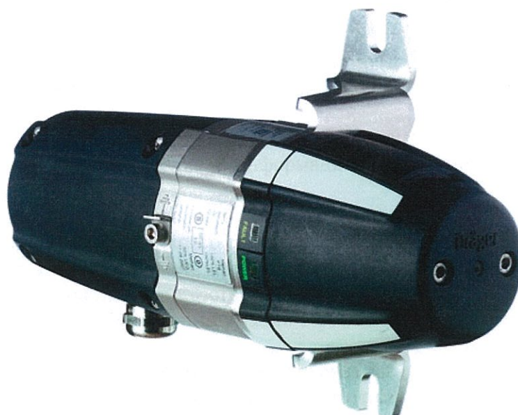
Рисунок 3 - Датчик оптический инфракрасный Dräger модели PIR 7200