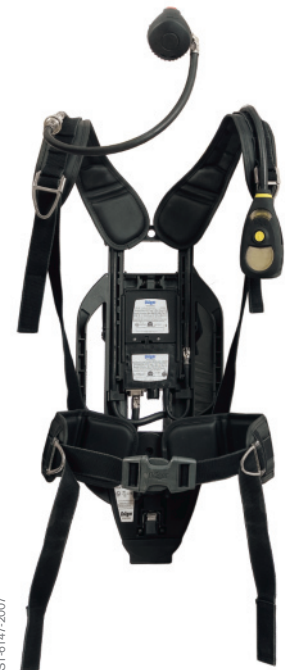
Dräger PSS® 7000 Современный дыхательный аппарат с электронным блоком контроля и сигнализации Dräger Bodyguard® 7000