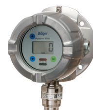
Dräger Polytron 5200 DD с DrägerSensor Ex PR DD для обнаружения горючих газов и паров.